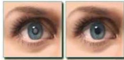
آب مروارید چشم

به معنی کدورت یا مات شدن عدسی چشم است که سبب اختلال عبور نور از عدسی چشم میشود.